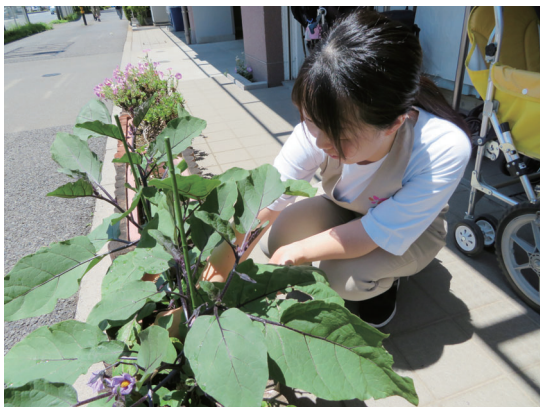
園の前では子どもたちと植物を育てています。

基本的に、はなさき保育園はこの園も同じように運営しているのですが、施設の大きな違いはないのですが、施設の環境や職員はどうしても異なる部分ではあるので慣れているところではあります。