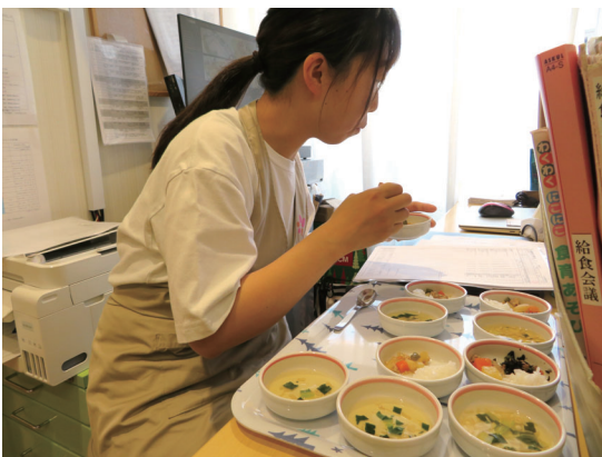
給食提供前の検食も園長の大切な仕事です。

以前の職場では、作り物が多く毎月壁面を華やかにするというような方針で大変さを感じていました。転職前にはなさき保育園に見学に来た時に、壁面をやっていないと聞いて衝撃を受けました。壁面をやらぬ分、保育や保育書類の作成に向き合うことができるのがいいなと思います。