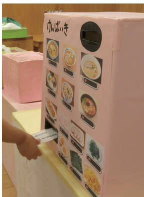
ラーメン屋さんに来た気分で 子どもたちは食事を楽しんでいました

特別給食の献立を立案する「チームもぐもぐ」という活動に令和5年度から参加しています。調理のことは、あまり知らなかったのですが、「大丈夫かな」とはじめは不安でしたが、実際に活動に参加してみると、担当になったことで子どもたちの反応が楽しみになり、どうしたら食べてくれるか考えるようになりました。活動に参加していなかったら、そこで食事に対して考える機会がなかったかなと思うので、参加して良かったと思います。 令和5年度は、各園から保育士1名が参加しましたが、話し合いの際に、調理工程を考える時に立ち止まってしまうこともありました。令和6年度は保育士2名・栄養士2名のメンバーで活動しており、実際に調理に携わっている職員が加わったことで幅が広がったように感じます。